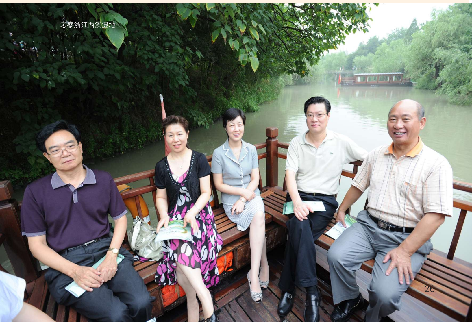
考察浙江西溪湿地