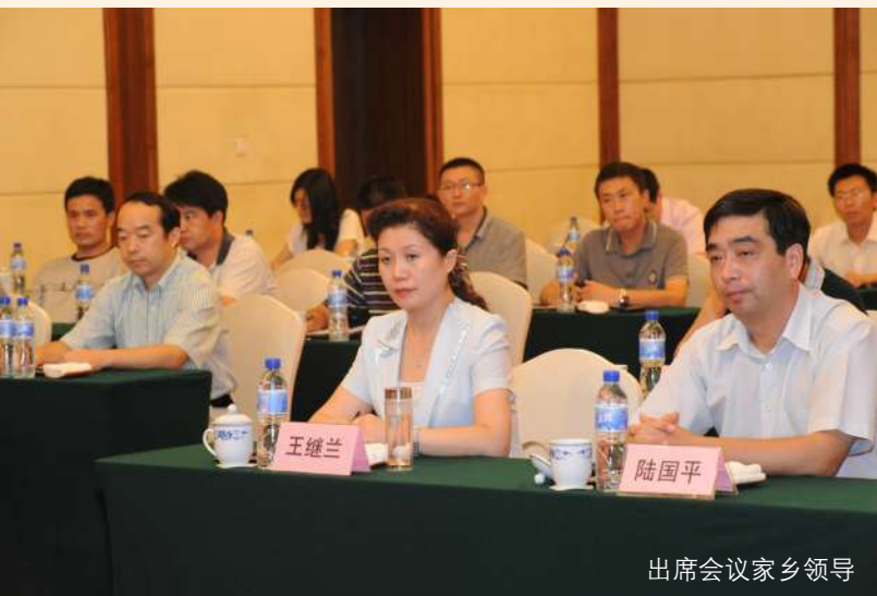
出席会议家乡领导