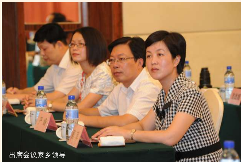
出席会议家乡领导