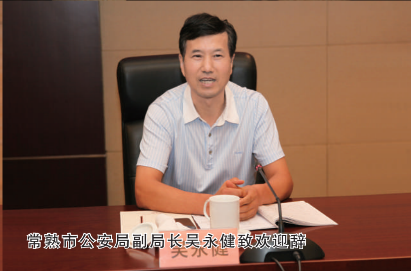
常熟市公安局副局长吴永健致欢迎辞