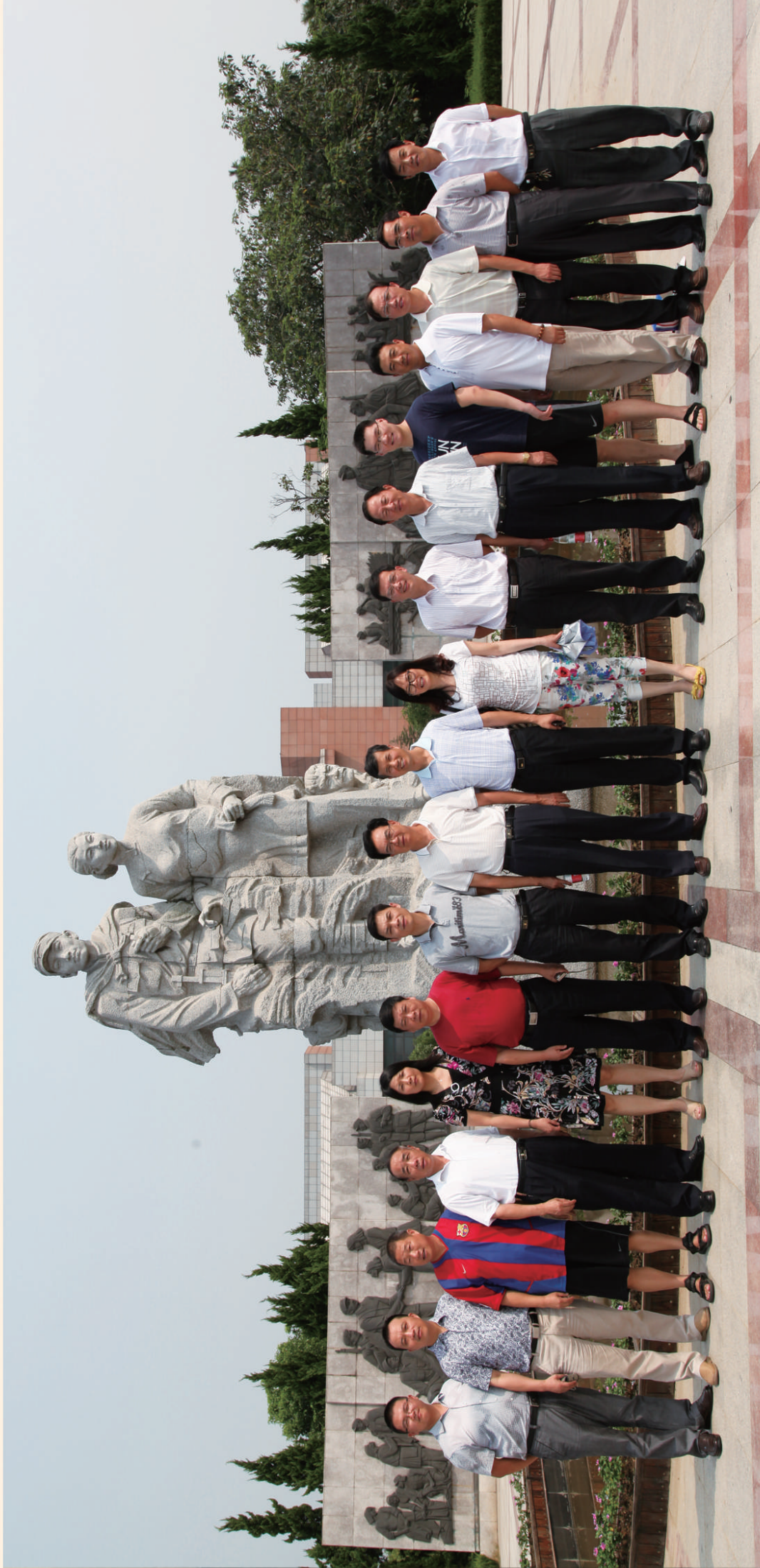
扬中发展促进会秘书长会议参会人员缅怀“沙家浜”革命斗争英雄