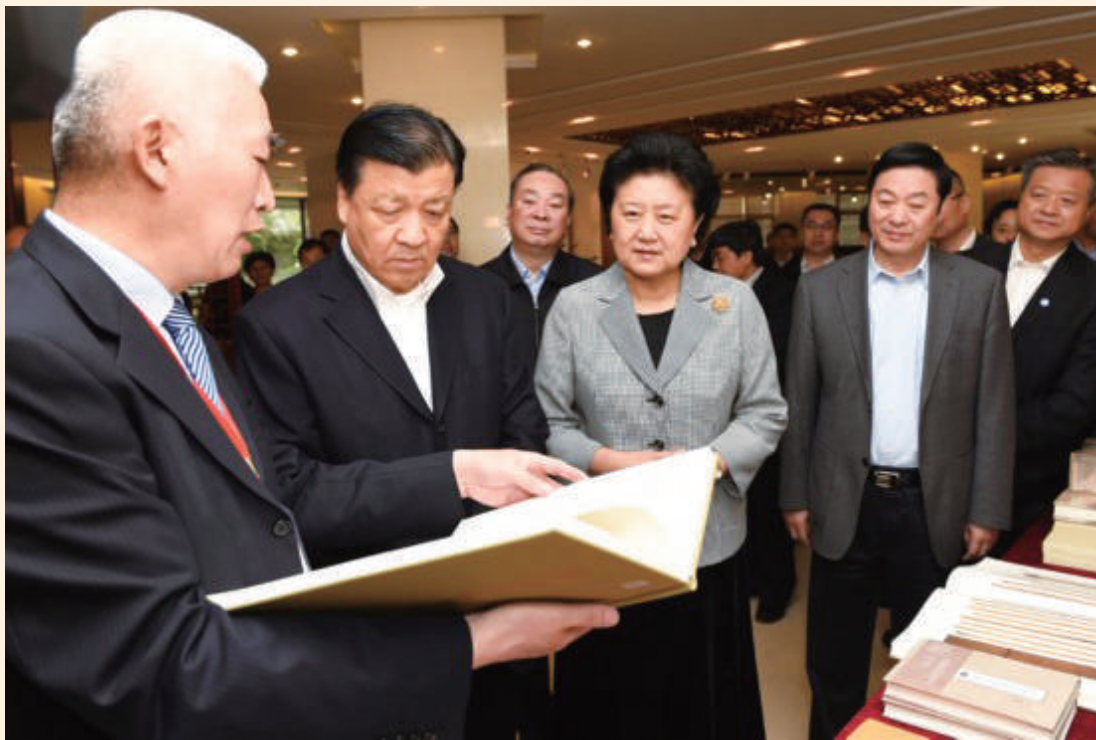
中共中央政治局常委、中央书记处书记刘云山来到中华书局,听取徐俊介绍

么稿子压了几年还没出版?我们当时还是铅字印刷,生产能力有限,极大地影响了出版周期。”徐俊说,正是因为体制机制没有跟上时代变迁的步伐,导致中华书局在上世纪90年代遭遇了“最艰难的时期”。