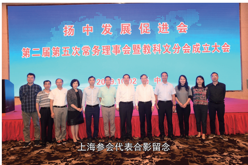
上海参会代表合影留念