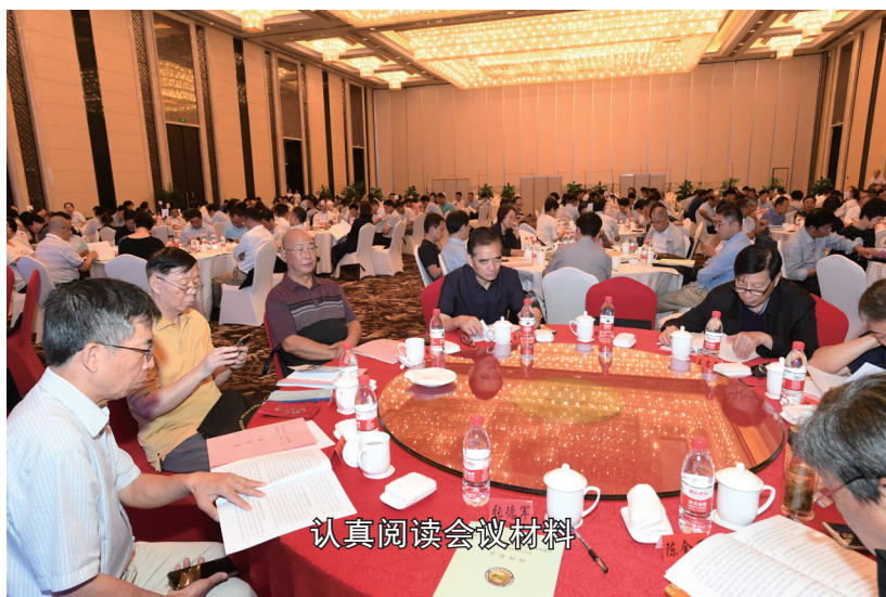
认真阅读会议材料