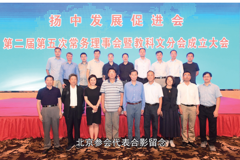
北京参会代表合影留念