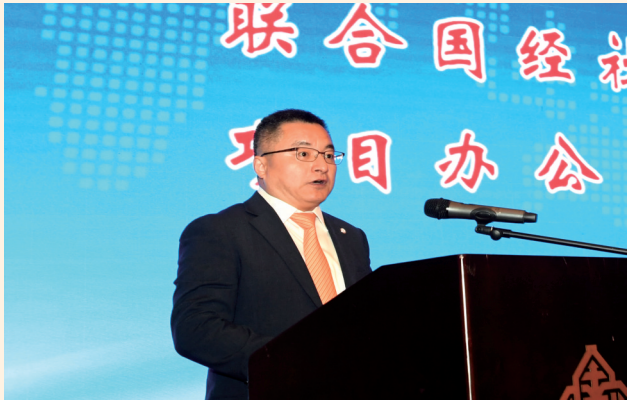
姚克平 联合国经社部公共治理项目办公室高级官员

一、关于教育。如何培养我们扬中的孩子,使其具备良好的学习知识、生活技能和批判思维的综合能力,未来更好地适应及领先技术革新,是我们迫切思考的问题。我们固然要强调成绩,但更要强调学习能力的培养。