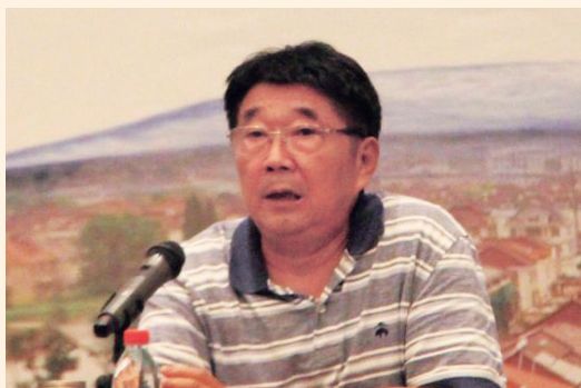
孙宏才 总装工程兵科研二所原所长、少将

北京地区教科文会员们要多交流、勤探讨,尽可能地把科研成果转换到扬中,让科研工作服务扬中发展,不断促进科研成果的工程化和产业化,让科研成果真正在扬中生根开花。同时扬中也要做好人才引进和培养,企业要不断提升生产技术,为科研成果转换打好基础,一起努力、共同提升才能让扬中更好更快发展。